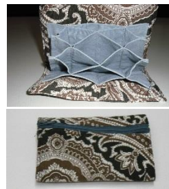
小銭とカード入れ

猫のカーテン留めは製作を始めて1年くらいになりますが、950匹を作って里子に出しました。今は1000匹を目標に頑張っています