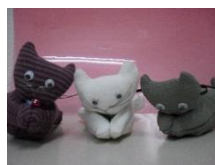
猫のカーテン留め