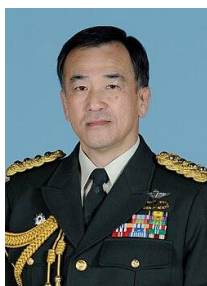
火箱 芳文さん (当時の陸上幕僚長)

そのとき、ある決断が数えきれない人の命を救いました。当時、陸上自衛隊トップであった火箱芳文（ひばこ よしふみ）氏は、正式な命令を待たず、発生からわずか30分で全国の自衛隊に出動を指示したのです。本来、自衛隊の出動には厳格な手続きがあります。知事の要請、大臣の命令、統合幕僚長の指示。それらを経なければ動けない。